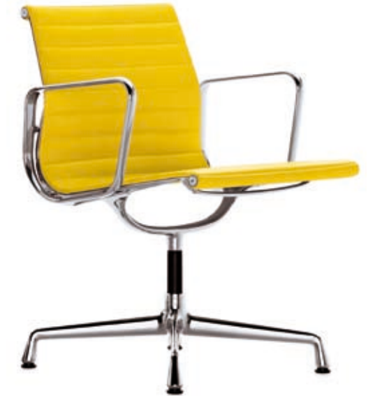
Der Aluminium Chair, Design Charles and Ray Eames (1958). Das Original produziert von Vitra.

Ich finde es immer wieder faszinierend, den Möbelstücken auf den Grund zu gehen. Viele der bekanntesten Klassiker stammen aus der Bauhauszeit. Mit der Industrialisierung mussten die Entwürfe einfacher gestaltet werden, denn die Möbel sollten in Serie produziert werden und erschwinglich sein. Diese Zeit brauchte ganz neue Gestaltungsansätze, und das Bauhaus gab diesen Anforderungen ein Gesicht. Die Entwürfe prägten eine Epoche, man sieht der Gestaltung und den Materialien an, zu welchem Zweck sie kreiert wurden – form follows function. Doch auch spätere Entwürfe, z.B. aus den 60er und 70er Jahren, haben sich bereits als Klassikern etabliert. Andere gelten schon heute als die zukünftigen Klassiker. Dass sie bis heute Bestand haben und noch lange Zeit haben werden, erfüllt mich mit Freude und Respekt.