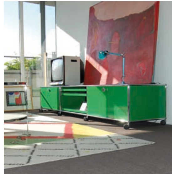
Möbelsystem, Design Fritz Haller (1962). Das Original produziert von USM Haller.

Ich finde es immer wieder faszinierend, den Möbelstücken auf den Grund zu gehen. Viele der bekanntesten Klassiker stammen aus der Bauhauszeit. Mit der Industrialisierung mussten die Entwürfe einfacher gestaltet werden, denn die Möbel sollten in Serie produziert werden und erschwinglich sein. Diese Zeit brauchte ganz neue Gestaltungsansätze, und das Bauhaus gab diesen Anforderungen ein Gesicht. Die Entwürfe prägten eine Epoche, man sieht der Gestaltung und den Materialien an, zu welchem Zweck sie kreiert wurden – form follows function. Doch auch spätere Entwürfe, z.B. aus den 60er und 70er Jahren, haben sich bereits als Klassikern etabliert. Andere gelten schon heute als die zukünftigen Klassiker. Dass sie bis heute Bestand haben und noch lange Zeit haben werden, erfüllt mich mit Freude und Respekt.