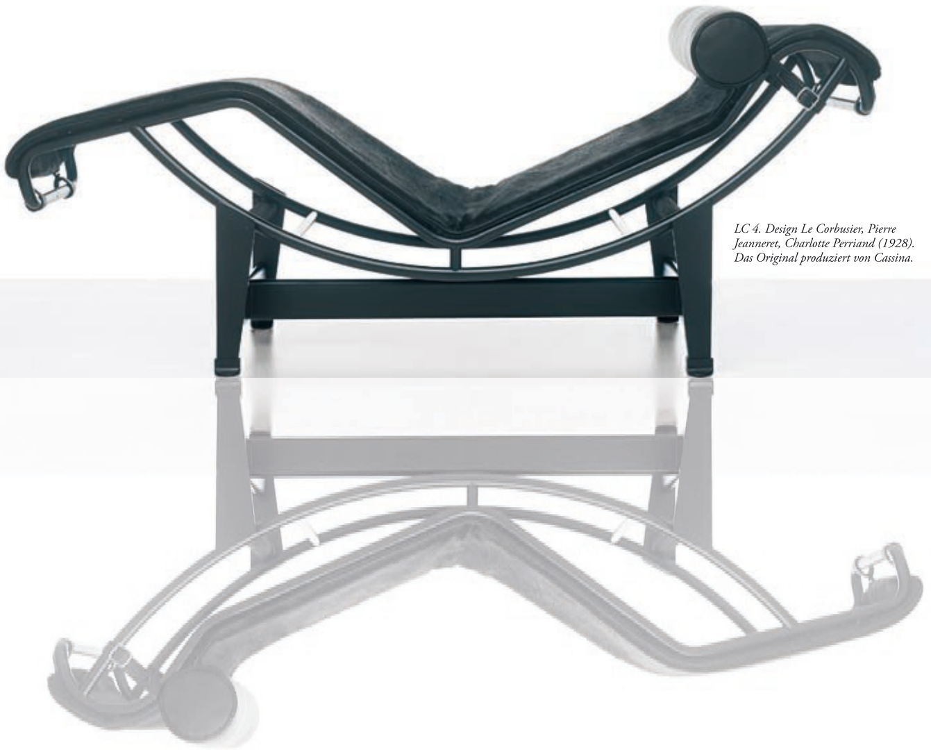
LC 4. Design Le Corbusier, Pierre Jeanneret, Charlotte Perriand (1928). Das Original produziert von Cassina.