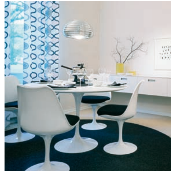
Tulip Chair & Table, Design Eero Saarinen (1956). Das Original produziert von Knoll International.

mit einem Augenzwinkern beantworten: Wer ein Original kopiert, weiß, dass er etwas Gutes kopiert. Schon Theodor Fontane gelangte zu der Überzeugung, dass Plagiate wahrscheinlich die aufrichtigsten aller Komplimente sind.