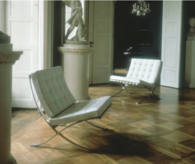
Sessel Barcelona, Design Ludwig Mies van der Rohe (1929). Das Original produziert von Knoll International.

die Prägung des Herstellers. Oft werden Zertifikate angehängt, die aber nicht immer fälschungssicher sind. Neben diesen Merkmalen gibt es nur kleine Unterschiede, die dem ungeübten Auge oft verborgen bleiben.