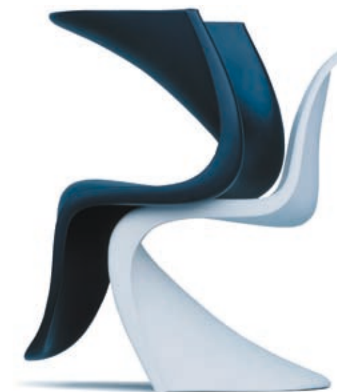
Der Panton Chair, Design Verner Panton (1959). Das Original produziert von Vitra.

Einige Hersteller versehen ihre Möbel mit Prägungen, einem Siegel oder anderen Merkmalen. Zusätzlich hat der Verband kreativer Inneneinrichter das Echtheitsiegel entwickelt. Der Freischwinger von Thonet, der Adjustable Table von Eileen Gray oder die LC-Liege tragen im Gestell