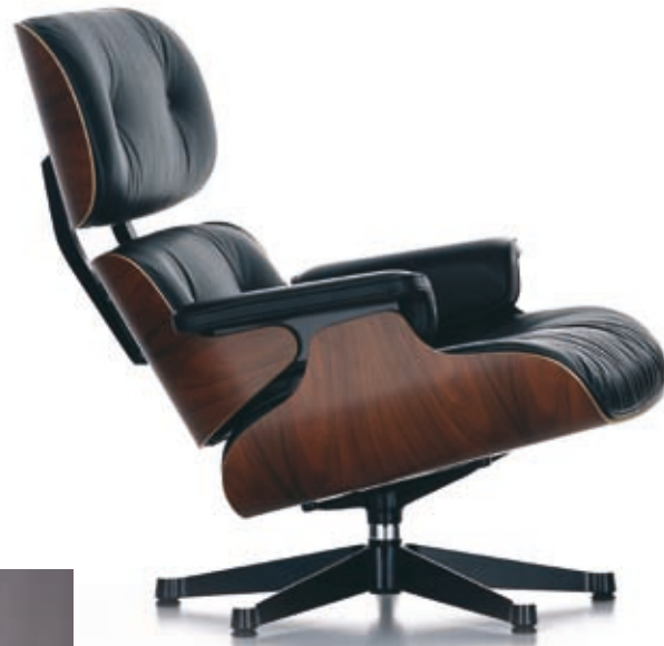
Lounge Chair, Design Charles and Ray Eames (1956). Das Original produziert von Vitra.