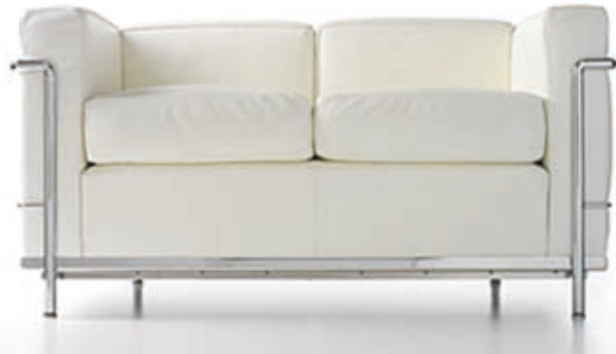
Sofa LC 2, Design Le Corbusier, Pierre Jeanneret, Charlotte Perriand (1928). Das Original produziert von Cassina.

Sie sind Trittbrettfahrer, die sich am geistigen Eigentum der Designer bereichern. Sie bewegen sich außerhalb der Legalität, und ich freue mich über alle Plagiatehersteller, derer die Justiz habhaft werden kann. Aber man kann das Ganze auch