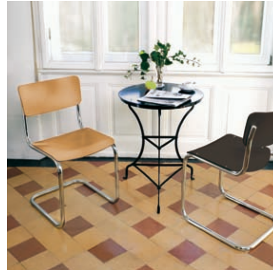
Der Freischwinger, Design Mart Stam (1931). Das Original produziert von Thonet.